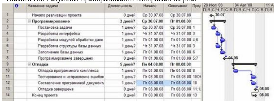
Рис. Результат преобразований